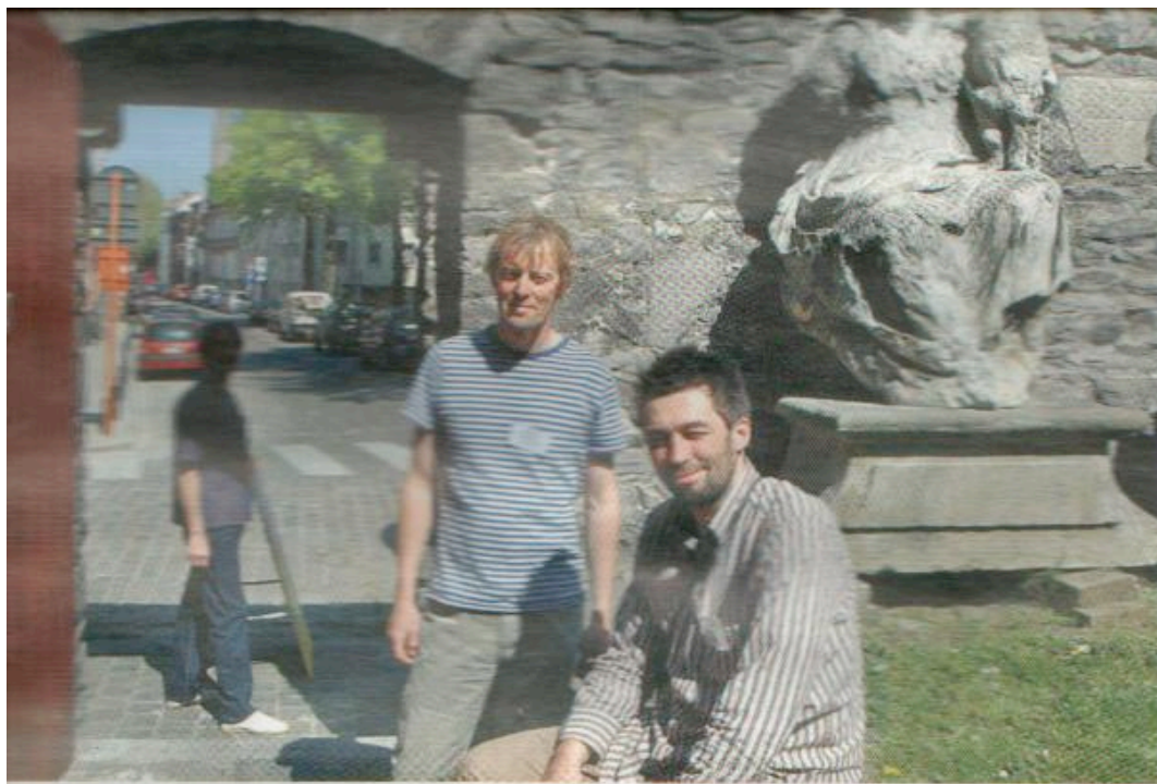
» Dankzij de 'Buren van de Abdij' is deze historische site op gezette tijden weer open.